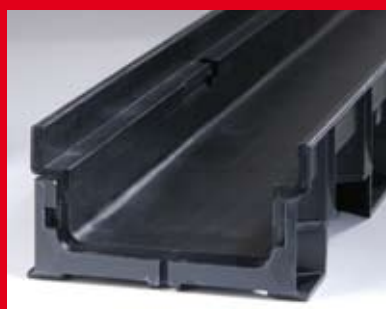
Žlab se sníženou výškou

Systém je testovaný na třídy zatížení A 15 – D 400. Pro použití, kterému odpovídá třída zatížení D 400, je k dispozici pouze žlab s hranou z pozinkované oceli.