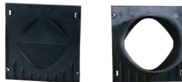
Čelní stěna a čelní stěna s nátrubkem

Příslušenství se na těleso žlabu montuje snadno díky bočním a svislým předtvarováním. Proto také u spoje 90° není zapotřebí zvláštní rohový prvek.