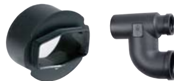
Sběrný koš na hrubé splaveniny