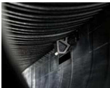
Systém bezšroubového upevnění roštů Drainlock

Na žlaby s kompozitními hranami mohou být usazeny rošty pro použití v třídě zatížení max. C250 a na žlaby s ochrannými hranami z pozinkované oceli až do třídy zatížení D400.