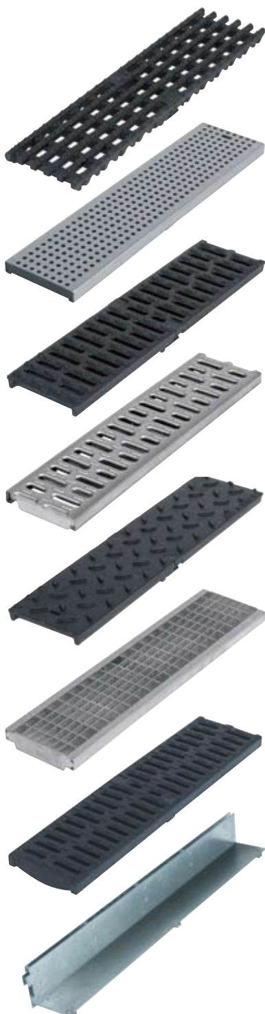
Litínový rošt s podélnými pruhy Třídy zatížení C250 – D400