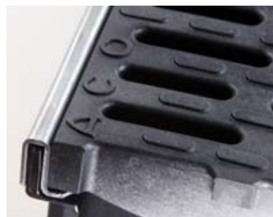
Žlab s ochrannými hranami z pozinkované oceli ACO XtraDrain X 100S pro použití až do třídy zatížení D400