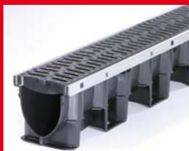
Žlab X100S s hranou z pozinkované oceli.