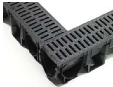
Rohový spoj 90°

Systém ACO XtraDrain odpovídá evropské harmonizované normě ČSN EN 1433.