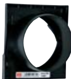
Čelní stěna s hrdlem