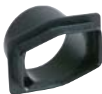
Adaptér pro napojení svislého odtoku DN100 nebo DN150