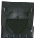
Plná čelní stěna (bez hrdla)