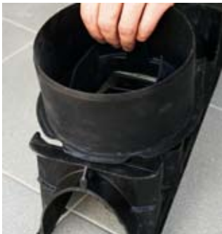
Nasazení přípojovacího adaptéru