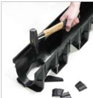
Vyražení předvarování pro vertikální odtok

Poznámka: žlaby musí být instalovány společně s vloženými rošty. Pro montáž platí naše všeobecné pokyny pro pokládku odvodňovacích žlabů.